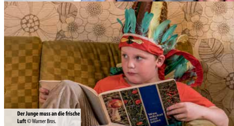
Der Junge muss an die frische Luft