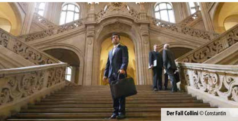
Der Fall Collini