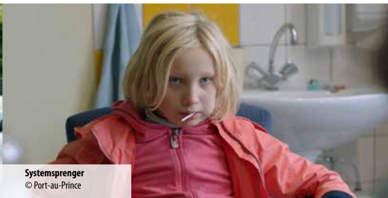
Systemsprenger © Port-au-Prince