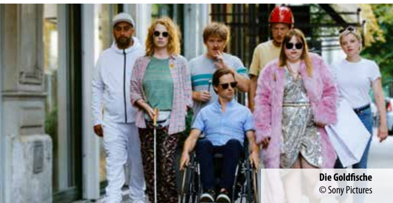
Die Goldfische