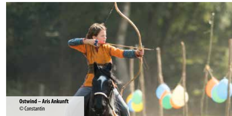
Ostwind – Aris Ankunft