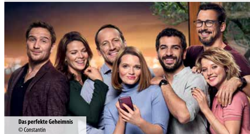
Das perfekte Geheimnis