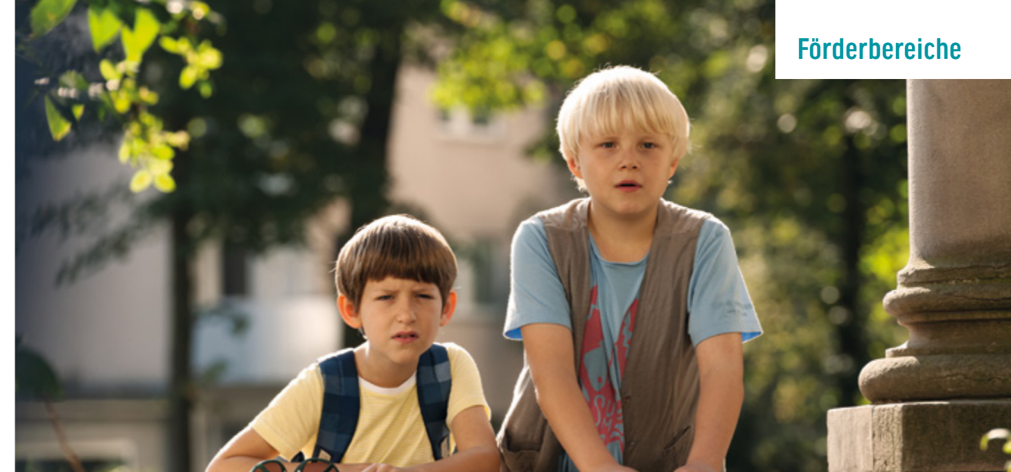
RICO, OSKAR UND DER DIEBSTAHLSTEIN

Die geförderten Filme und die einzelnen Förderbeträge sind auf den Seiten 71 bis 72 aufgeführt.