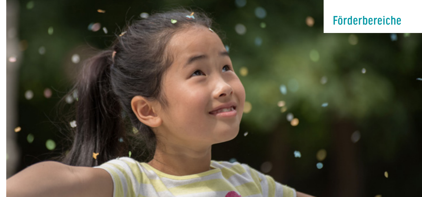
ENTE GUT! MÄDCHEN ALLEIN ZUHAUS | © WELTKINO

Die Titel der geförderten Filme und die einzelnen Förderbeträge sind auf Seite 66 aufgeführt.