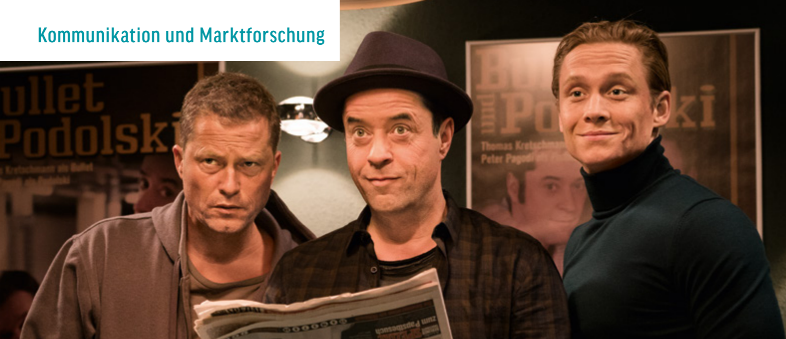
VIER GEGEN DIE BANK