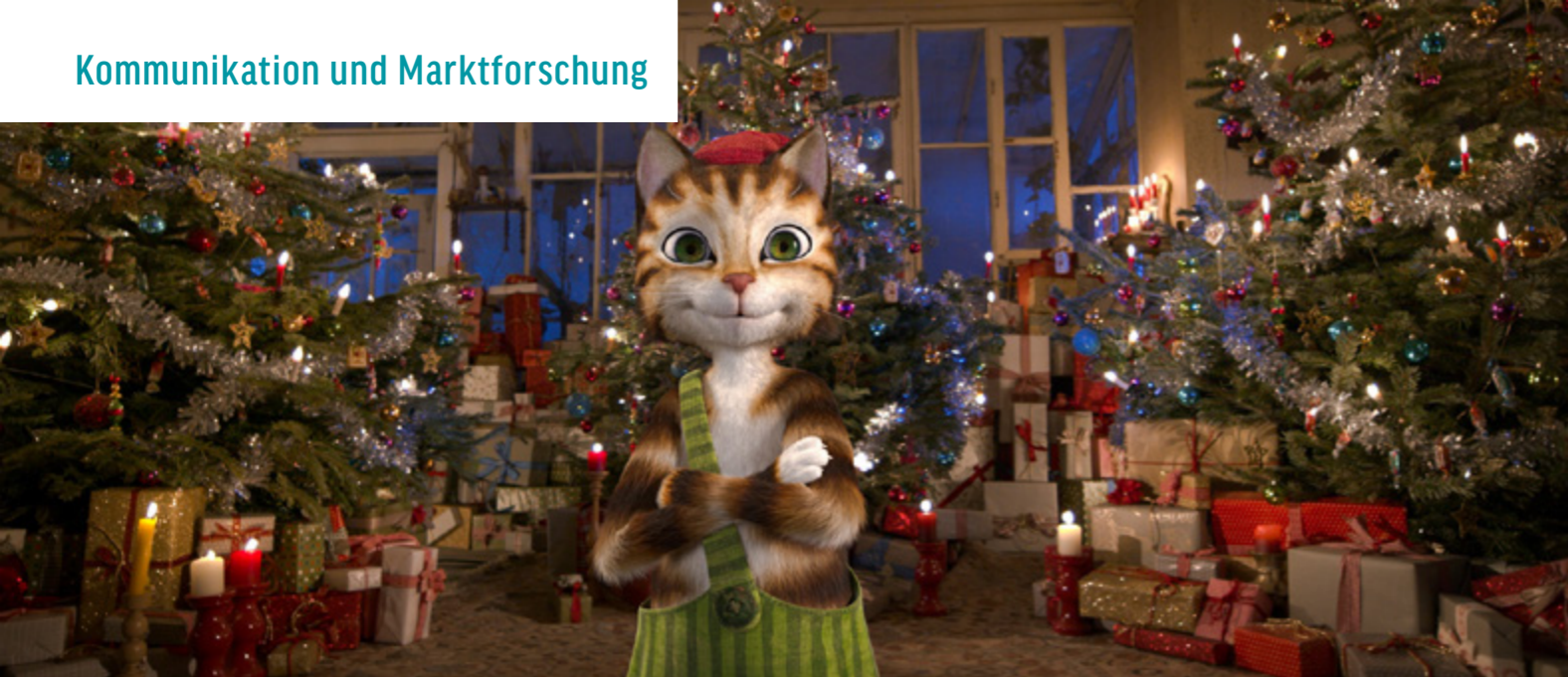
PETTERSSON UND FINDUS: DAS SCHÖNSTE WEIHNACHTEN ÜBERHAUPT | © WILD BUNCH