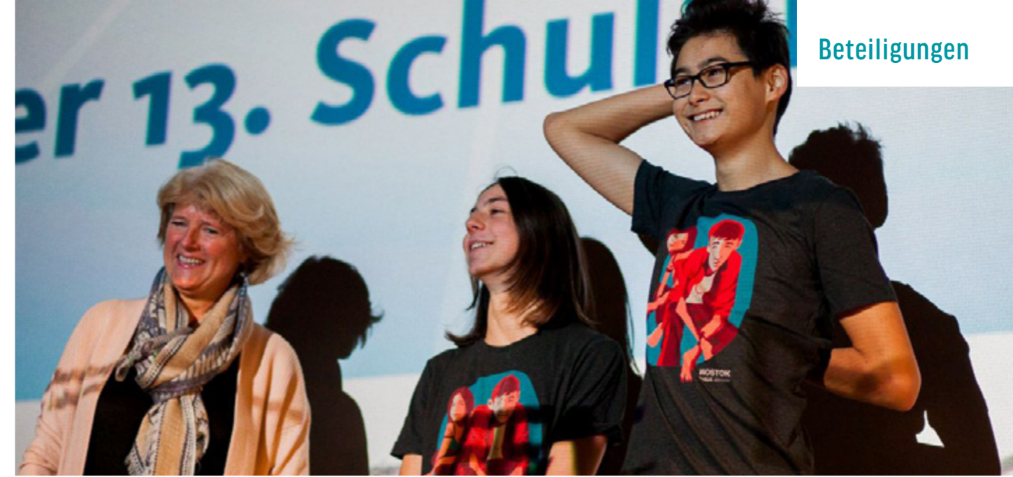
ERÖFFNUNG DER SCHULKINOWOCHEN BERLIN

Neu gestartet hat German Films 2016 die Initiative FACE TO FACE WITH GERMAN FILMS. Sie rückte sechs deutsche Schauspielerinnen ins Rampenlicht, die in einigen der 2016 international erfolgreichsten Filme aus Deutschland zu sehen waren oder in vielversprechenden neuen Projekten spielten. Sie repräsentierten einige von vielen dynamischen „Gesichtern“ im gegenwärtigen deutschen Filmschaffen in einer Reihe von Marketing- und PR-Maßnahmen.