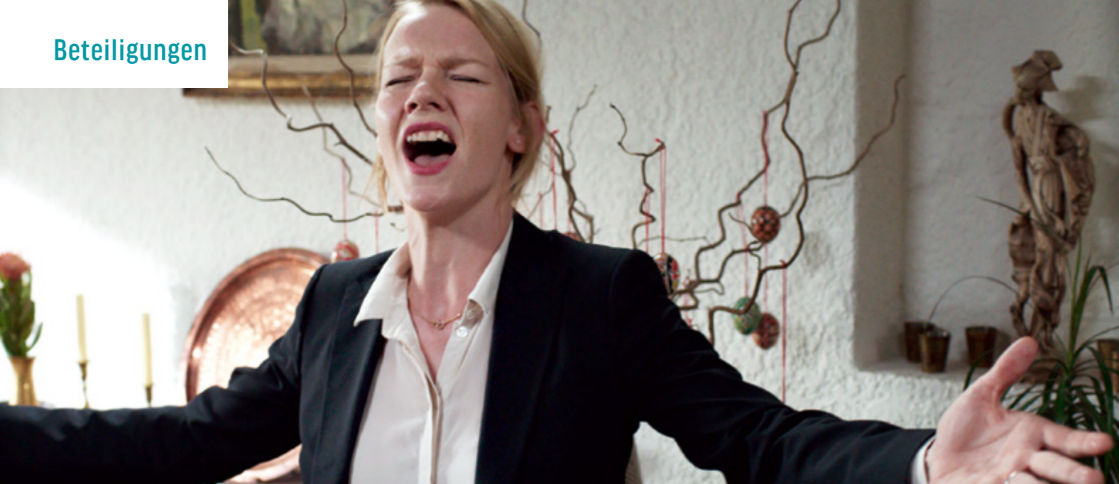
TONI ERDMANN