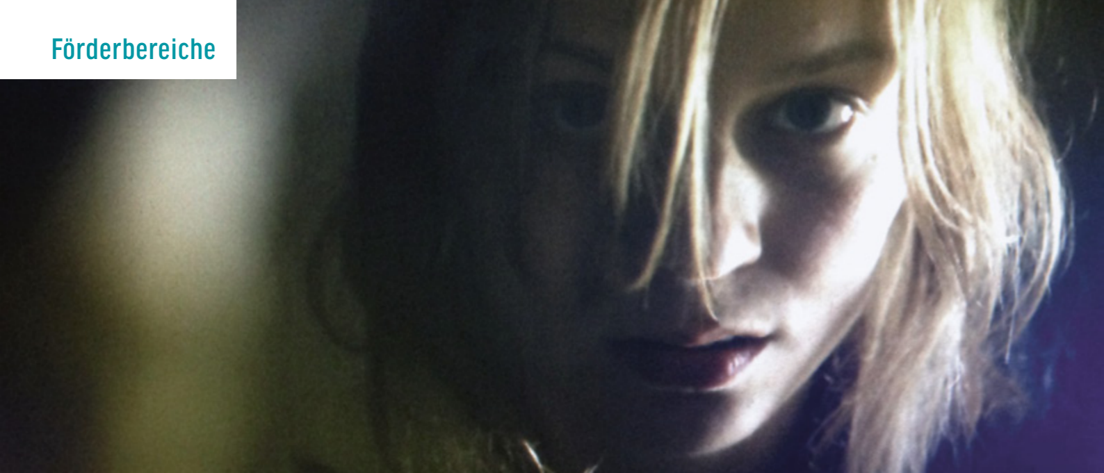
WILD | © NFP