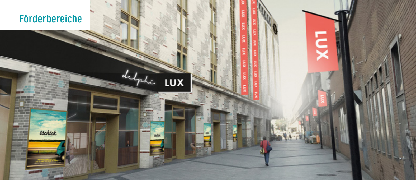
DELPHI LUX