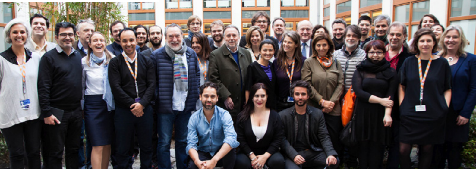
DEUTSCH-CHILENISCHES PRODUZENTENTREFFEN WÄHREND DER BERLINALE