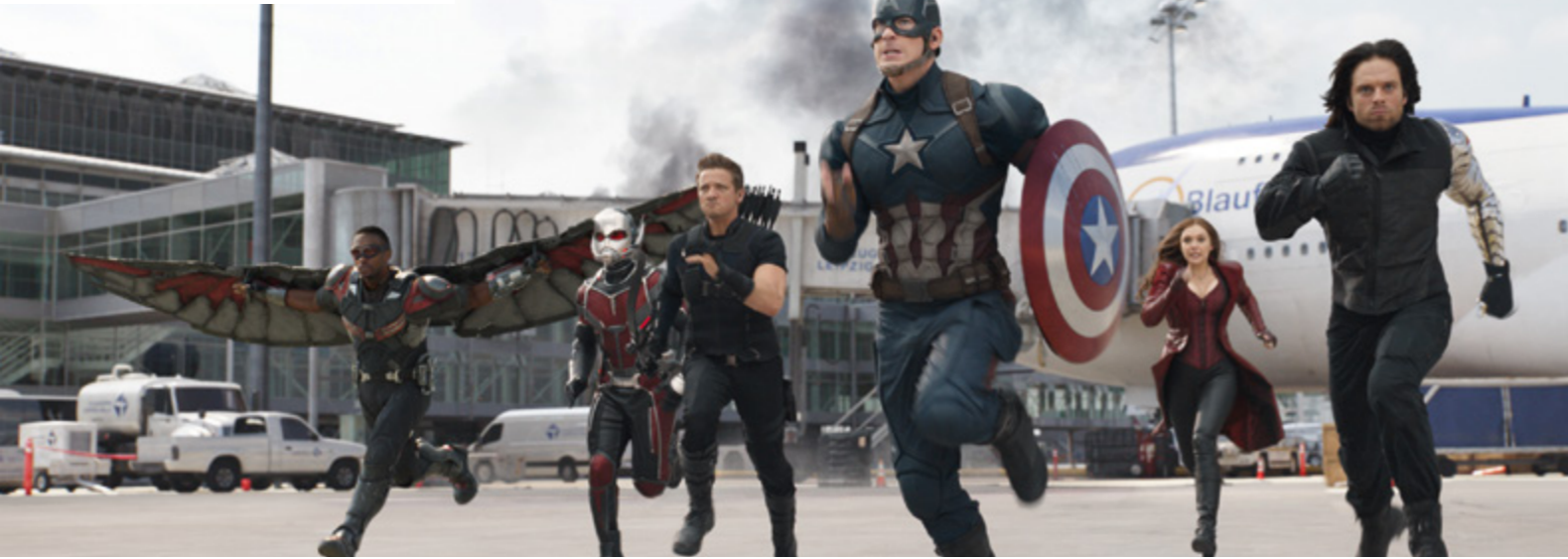
THE FIRST AVENGER: CIVIL WAR