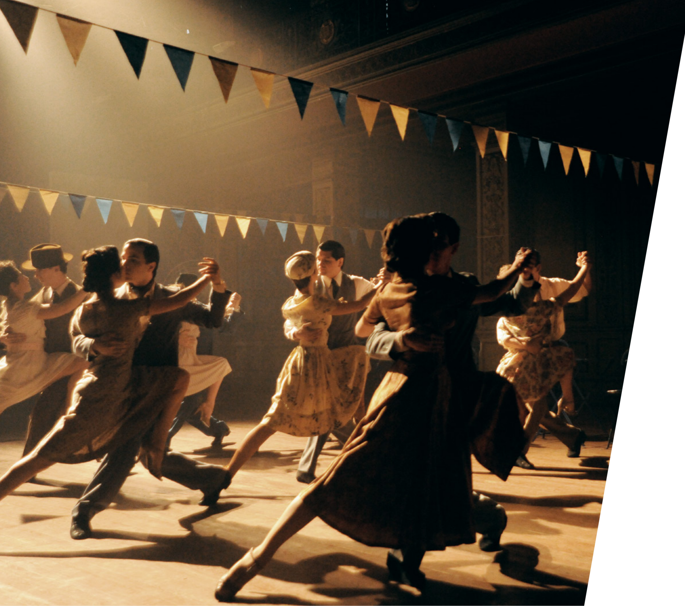
EIN LETZTER TANGO