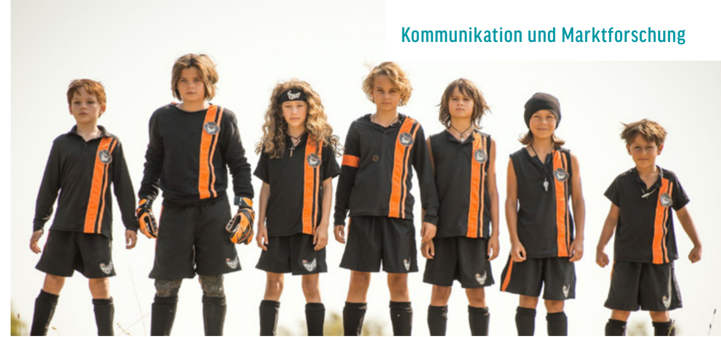
DIE WILDEN KERLE - DIE LEGENDE LEBT