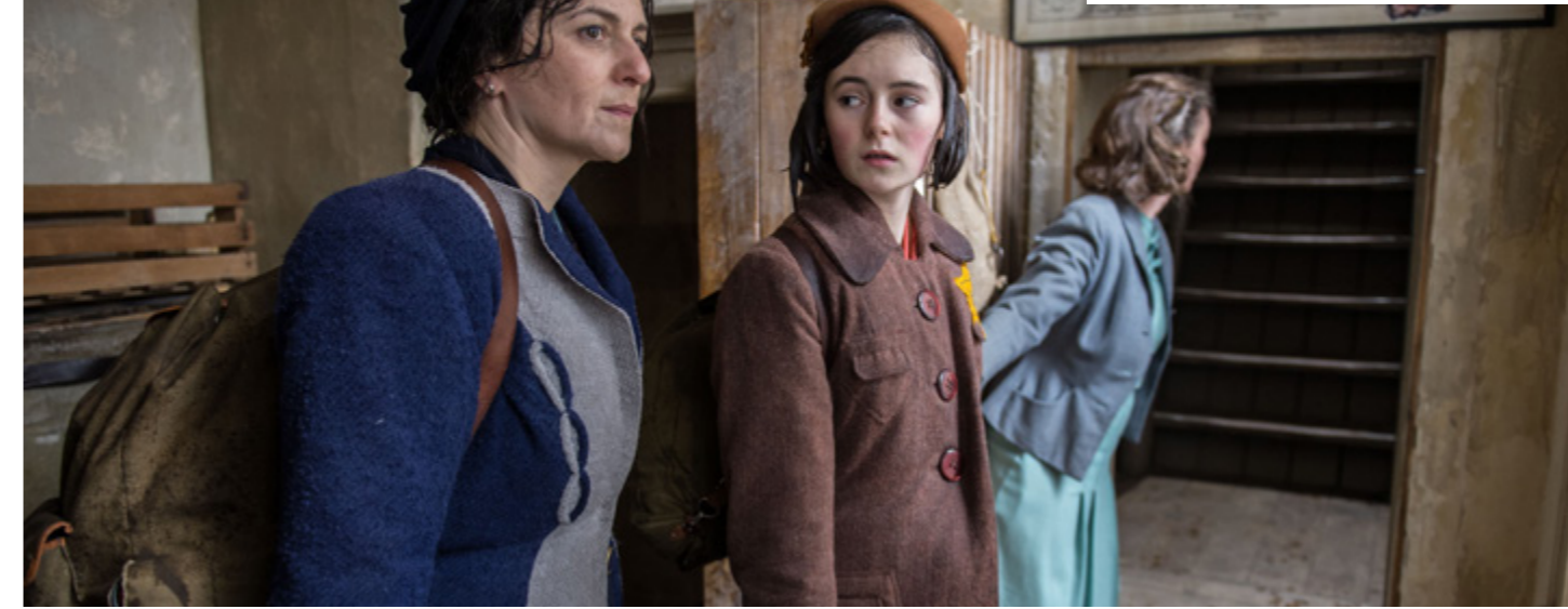
DAS TAGEBUCH DER ANNE FRANK