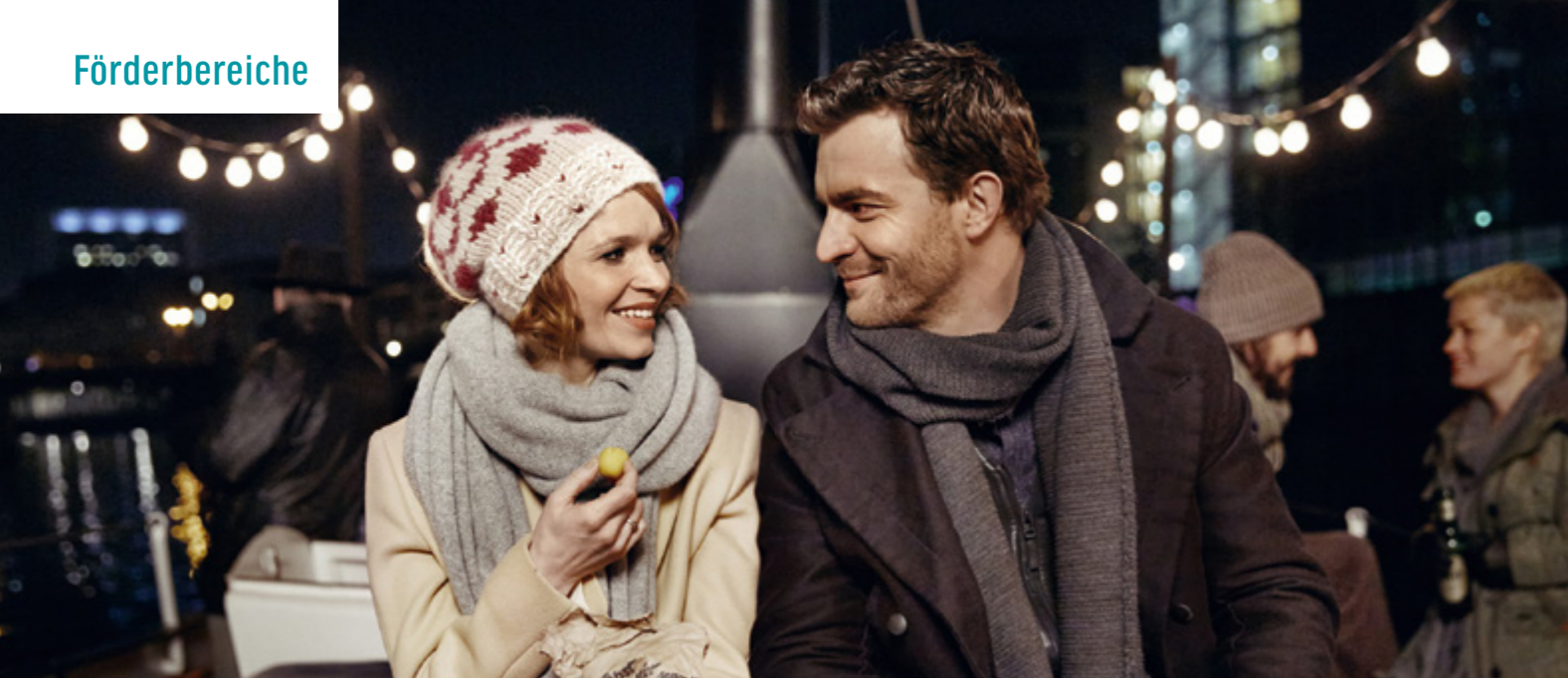
SMS FÜR DICH