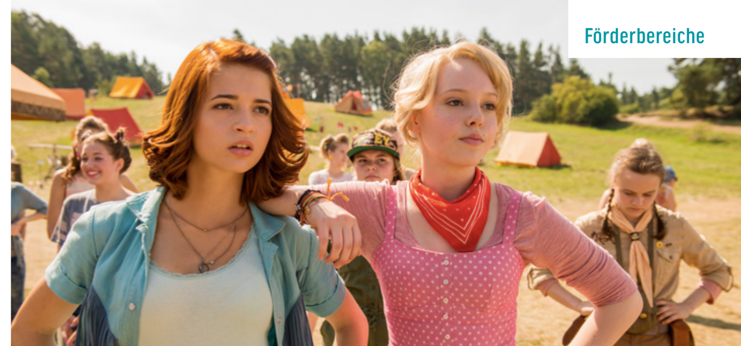
BIBI & TINA - MÄDCHEN GEGEN JUNGS © DCM