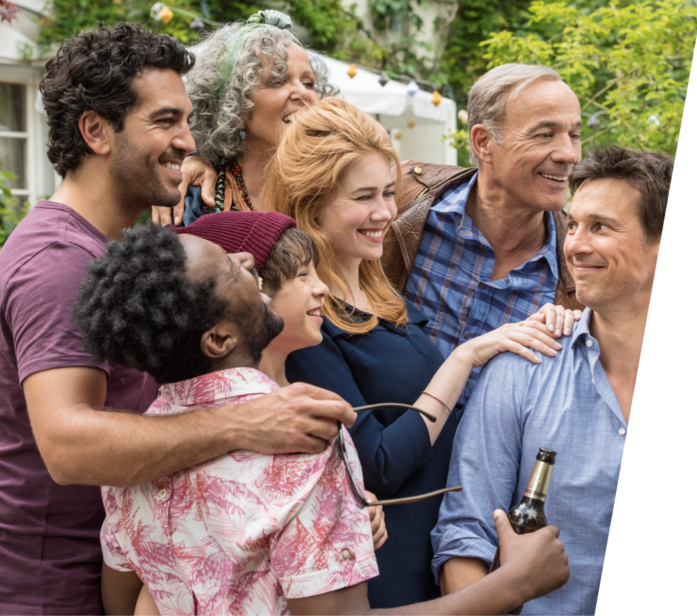
WILLKOMMEN BEI DEN HARTMANNS