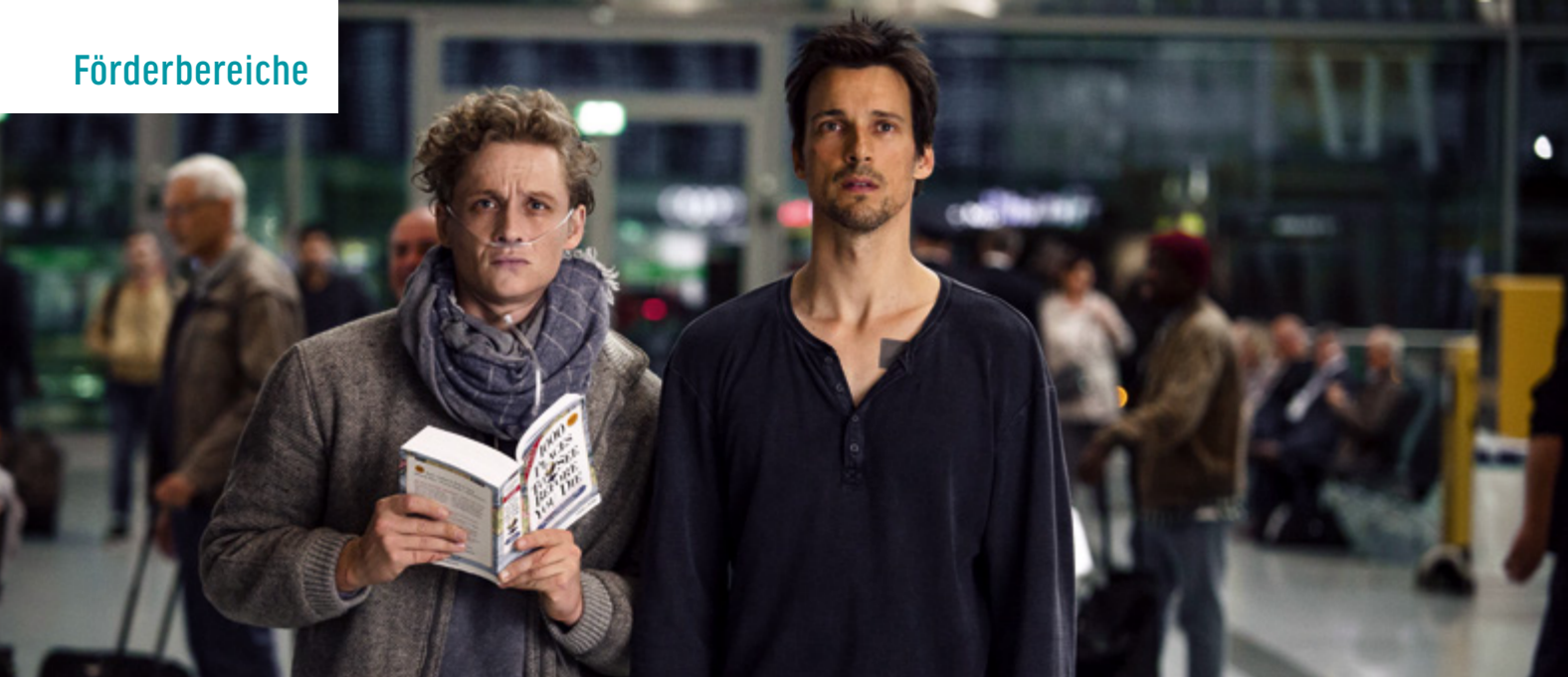
DER GEILSTE TAG

Elementare Aufgabe der FFA ist die Förderung des deutschen Films. Dies kann auf die unterschiedlichste Weise geschehen. In diesem Bericht spiegeln wir ein Gesamtbild der Förderaktivitäten der FFA wider. Es werden die einzelnen Förderbereiche dargestellt, und es wird dargelegt, welche Mittel in den einzelnen Bereichen eingesetzt wurden. Hier kann aber nur ein grundsätzlicher Überblick gegeben werden.